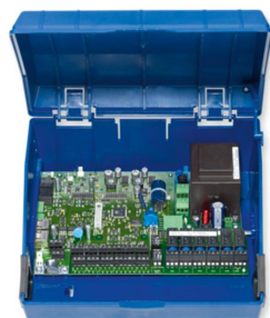
EASYLAB- ADAPTERMODUL TAM