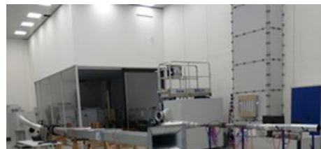
TROX GMBH CONTROL TECHNOLOGY