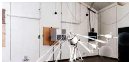
TROX GMBH COUSTICS