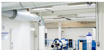
TROX AURANOR KUSTIKK