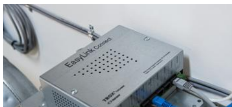
TROX AURANOR KLIMATEKNIKK