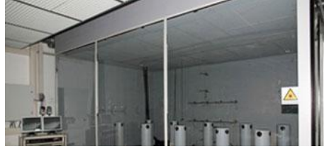
TROX GMBH AIR DISTRIBUTION TECHNOLOGY