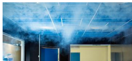
TROX AURANOR STRØMNINGSTEKNIKK