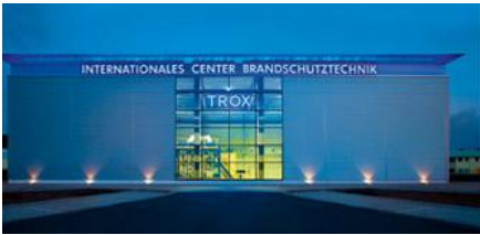
TROX GMBH FIRE AND SMOKE PROTECTION