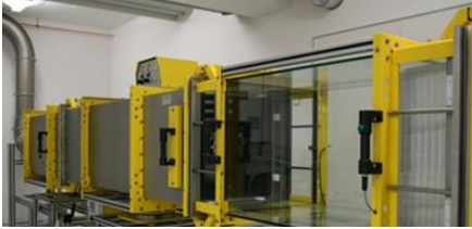
TROX GMBH FILTER TECHNOLOGY